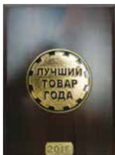
Лучший товар года СФО 2016 г

Компания «Берли» работает на рынке профессиональных моющих и чистящих средств. Зарубежный опыт разработок и современное производство, отвечающее современным требованиям, гарантируют стабильно высокое качество нашей продукции.